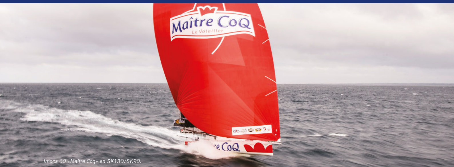
Imoca 60 «Maitre Coq» en SK130/SK90.